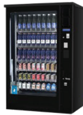
G-DRINK 9 OUTDOOR DM9 OD