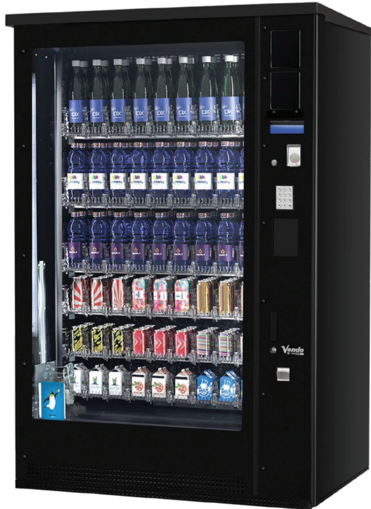
G-Drink DM 9 OD Vertical Outdoor