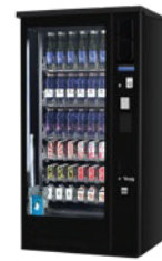
G-DRINK 6 OUTDOOR DM6 OD