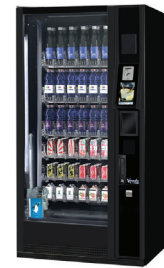
G-DRINK 6 TOUCH DT6