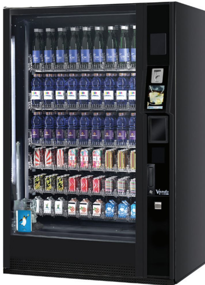
G-Drink 9 Vertical Touch