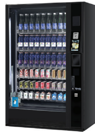
G-DRINK 9 TOUCH DT9