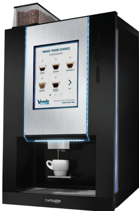
CaffèUNO mit Bohnenglas Halbautomatische Espressomaschine mit Touchscreen. Ideal für das Frühstücksbuffet.