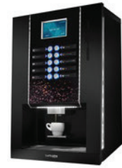
CAFFÈUNO "PRO" ESPRESSO mit Bohnglas semiautomatic TSC