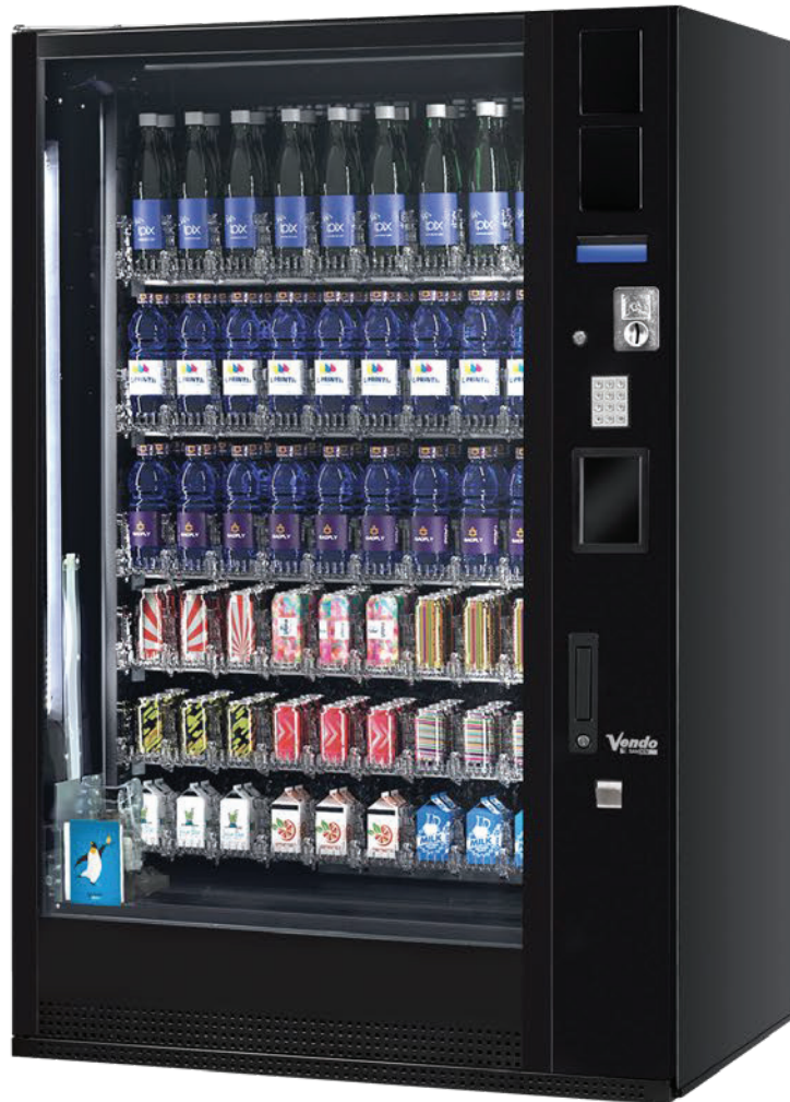
G-Drink DM 9 Vertical