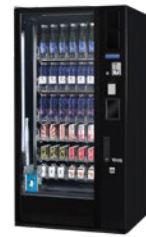
G-DRINK 6 STANDARD DM6