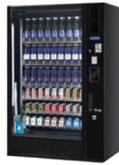
G-DRINK 9 STANDARD DM9