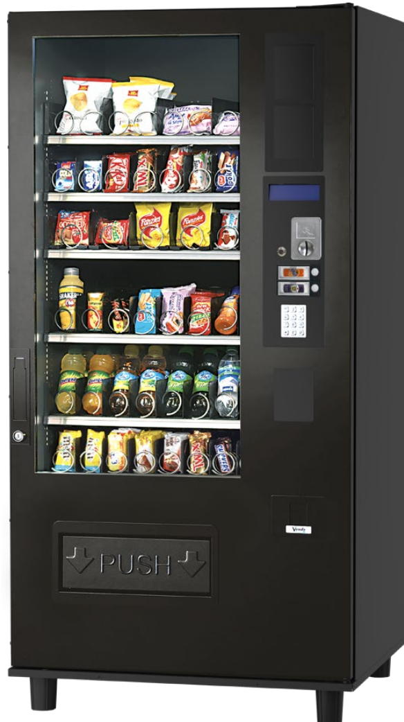
G-Snack Budget Combi